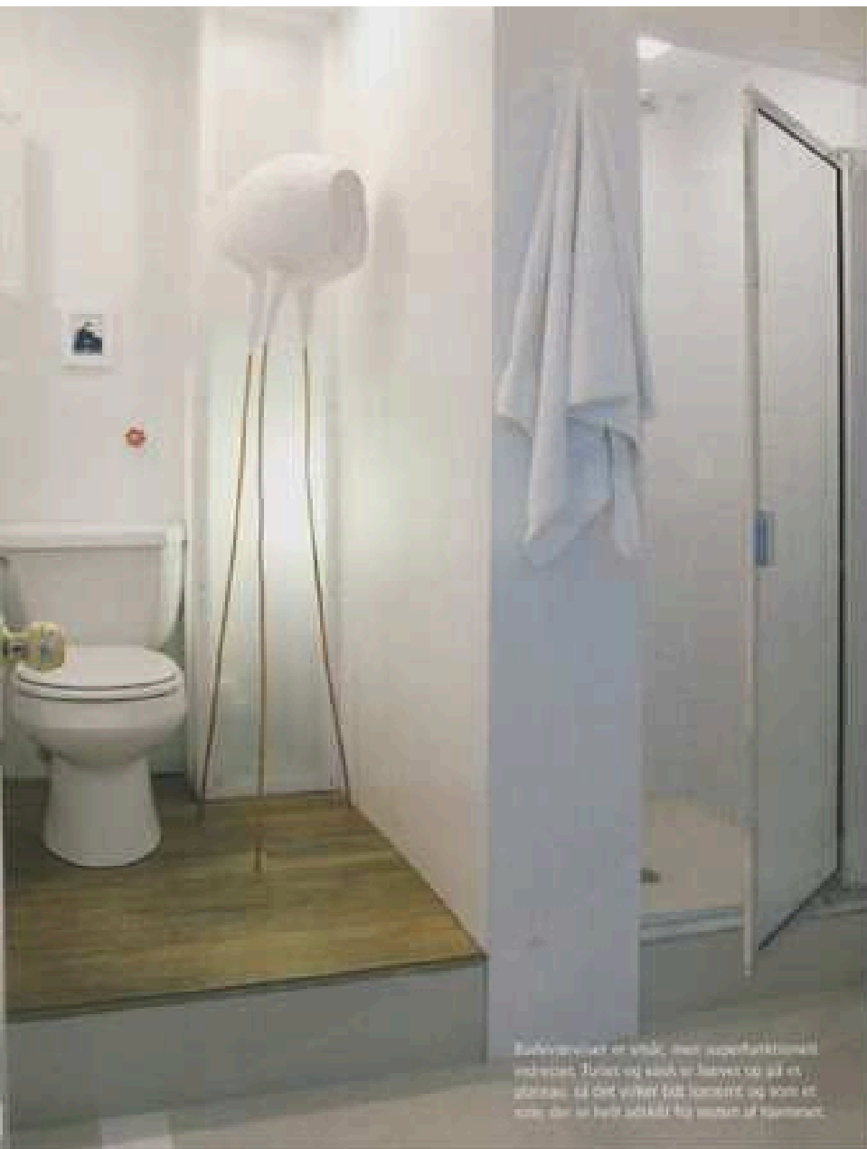
Bælysvampen er skabt med superfaktiskemet i træ. Tuden og stæb er lavet af et 15. størrelse, så det virker lidt mindre og som et nyt, der er helt udstyrt for vask af tøj.